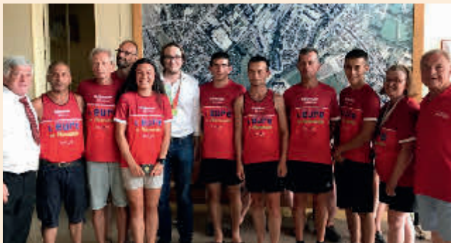
Le maire de Gisors accueille l'équipe de l'EURE.

Cet esprit, cette ambiance, on les retrouve à chacune des éditions de La France en courant. Ils demeurent grâce à des bénévoles qui assurent une bonne organisation de la course mais aussi de l'intendance.